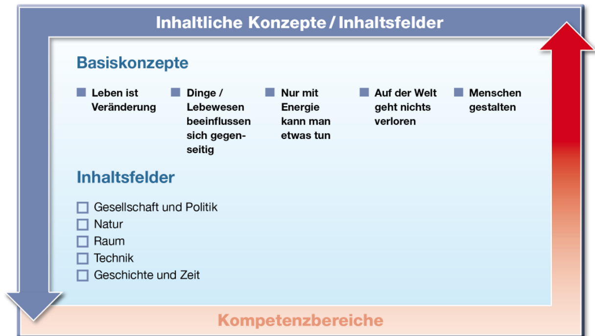
Abb. 2: Basiskonzepte und Inhaltsfelder

Fünf Inhaltsfelder des Sachunterrichts bilden den Rahmen, in dem sich Lernende die natürliche, soziale und technisch gestaltete Welt unter verschiedenen Perspektiven erschließen. Die Vernetzung der Inhaltsfelder ermöglicht es den Kindern, Handlungswissen in Zusammenhängen zu erwerben und befähigt sie, aktuelle Anforderungssituationen zu bewältigen.